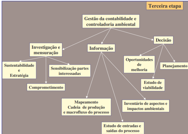
Figura 1. Estrutura da terceira etapa

Cabe ressaltar que para este estudo utiliza-se somente a segunda fase, “Informação” a qual é contemplada na terceira etapa do modelo. Na Figura 1 são apresentadas as fases que formam a terceira etapa, a saber: Investigação e Mensuração; Informação e Decisão.