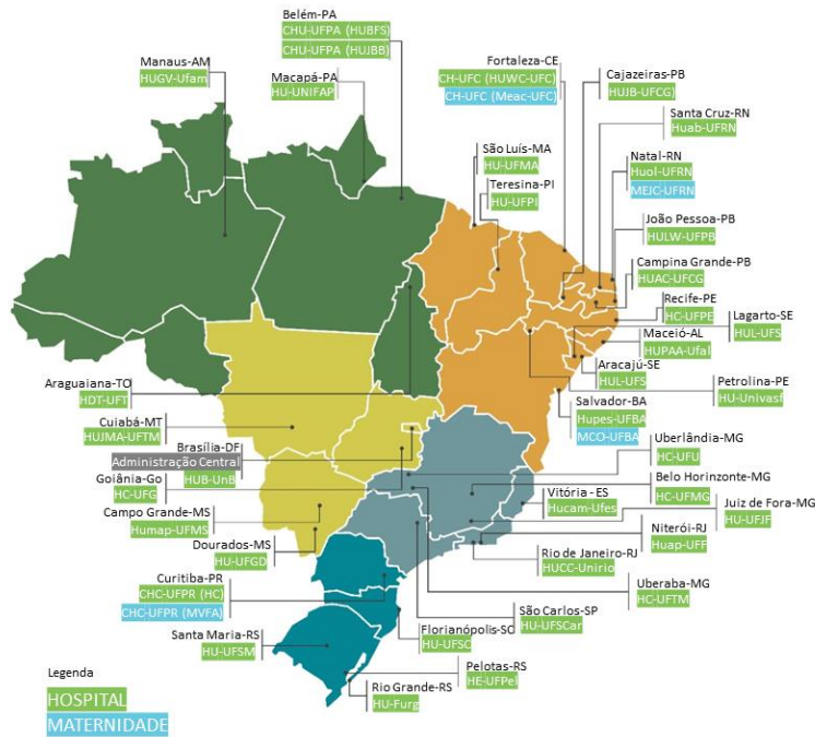
Figura 3. Hospitais Universitários administrados pela EBSERH